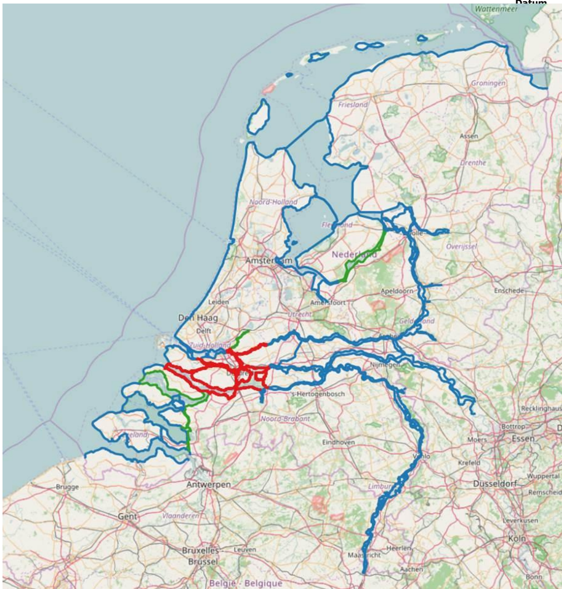
Figuur 2: Trajecten waar met Ringtoets/Hydra-NL kan worden gerekend (blauw), Hydra-NL moet worden gebruikt (groen) en expert advies moet worden aangevraagd (rood). 3