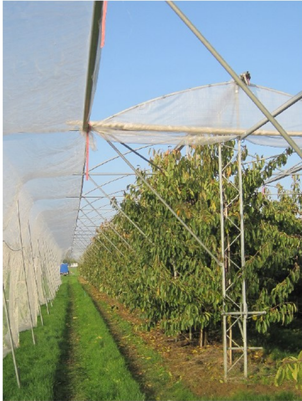
Mogelijke opstelling: Suzuki-fruitvlieggaas bevestigd aan constructie overkapping.