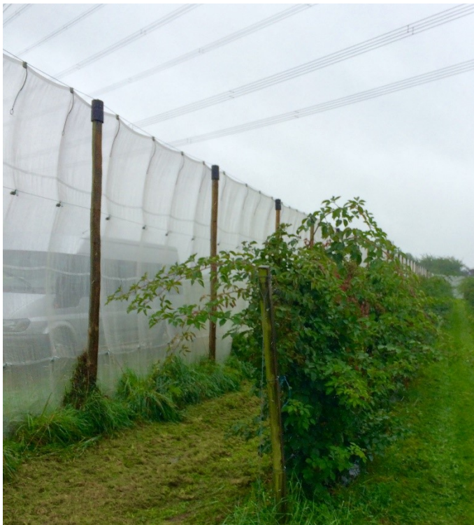
Mogelijke opstelling: Suzuki-fruitvlieggaas bevestigd aan een losstaand recht opgaande constructie.