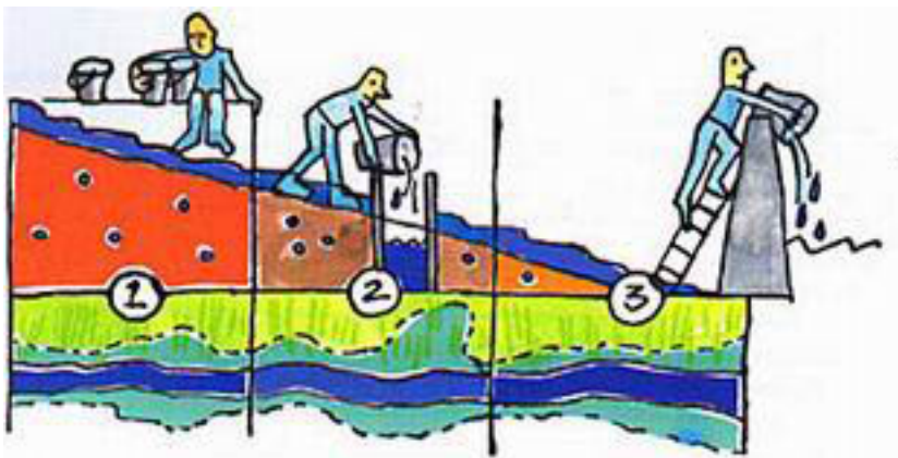
Figuur 2.1 Drietrapsstrategie: vasthouden-bergen-afvoeren

Waterbeheerders dienen zich ervoor in te zetten dat het ene gebied zijn waterproblemen niet afwentelt op een lager gelegen gebied door het water zo snel mogelijk af te voeren. Dat betekent dat een overvloed aan water eerst wordt vastgehouden in het gebied. Lukt dat niet langer, dan wordt het water tijdelijk opgevangen in waterbergingsgebieden. Pas daarna wordt het water afgevoerd.