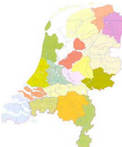
Figuur 2.3 De 17 deelstroomgebieden

Nederland bestaat uit 17 deelstroomgebieden, zoals figuur 2.1 toont. Voor elke deelstroomgebied is in het kader van WB21 een regionale watervisie, ofwel deelstroomgebiedsvisie, opgesteld. Deze visies zijn geen wettelijke planfiguren maar worden wel door Gedeputeerde Staten vastgesteld. De provincies hebben in samenwerking met waterschappen en – in een aantal gevallen - in overleg met gemeenten de visies ontwikkeld. De visies beschrijven de waterproblematiek in het deelstroomgebied en mogelijke oplossingen hiervoor. Naast technische oplossingen, zoals malen en verhogen van kades, is vooral aandacht besteed aan het creëren van ruimte voor water door bijvoorbeeld herstel van beekdalen. In totaal zijn er 16 deelstroomgebiedsvisies opgesteld, daarvoor de twee Groningse deelstroomgebieden één integrale visie is uitgewerkt.