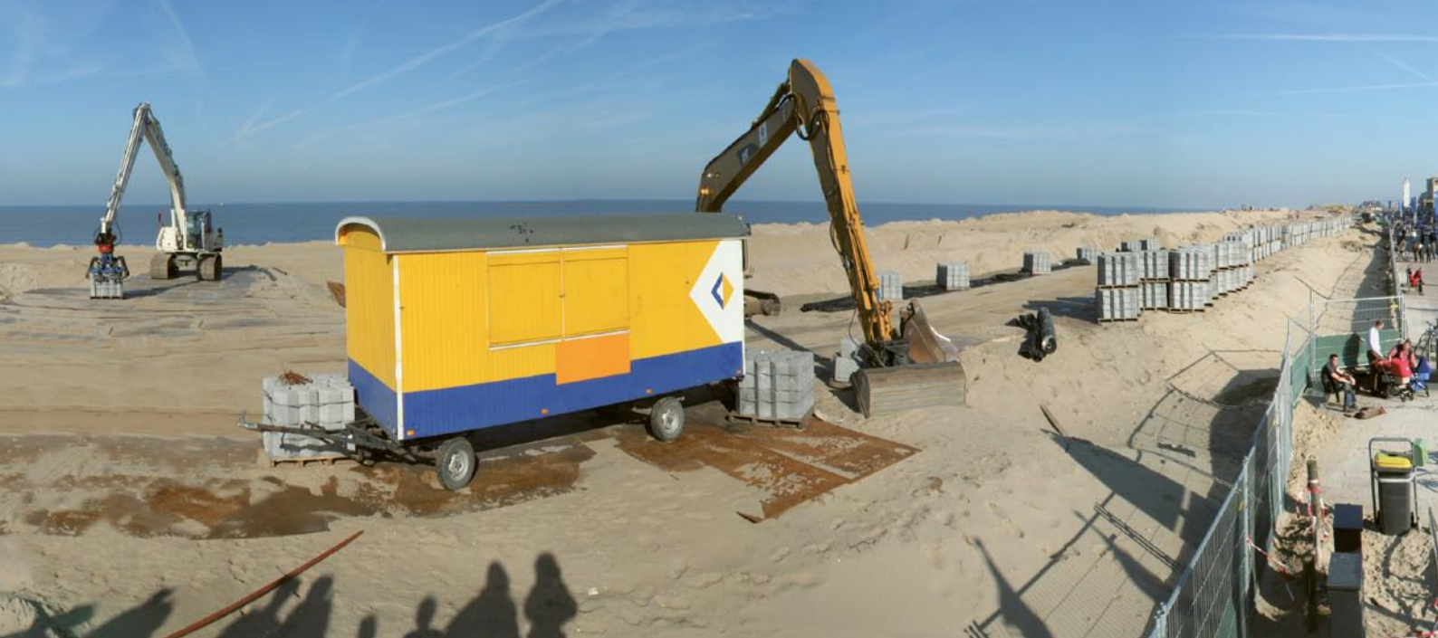
Werk aan Zwakke Schakel Noordwijk.