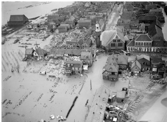
Stavenisse, 1953.