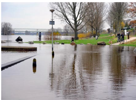
De Maas bij Mook, 2010.