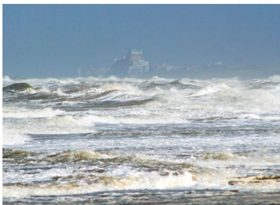
Dreiging vanuit zee.