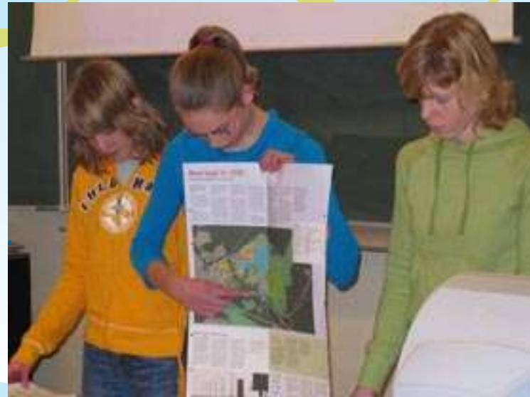
Leerlingen van het Wessel Gansfort College tijdens een spreekbeurt over waterbeheer