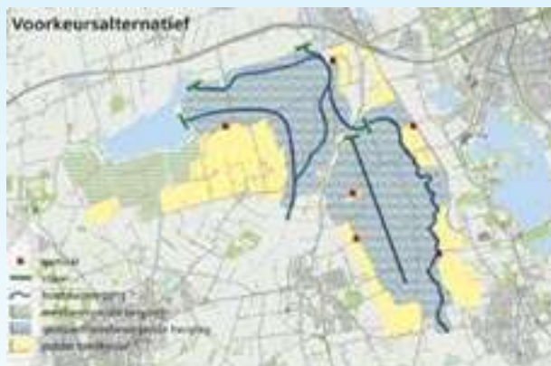
Het voorkeursalternatief (vastgesteld in juli 2006) voor de inrichting van de combinatie van waterberging en natuur in de Eelder- en Peizermeden en het Leekstermeergebied.

"De manier waarop het project wordt aangepakt, bevalt me prima. In de klankbordgroep konden we als betrokken bewoners heel goed ons ei kwijt. Zo hebben we gepleit voor grazers om het gebied te onderhouden. Want als je stadjes wilt trekken, moet er toch wel wat te zien zijn."