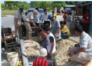
Herstel en aanleg van de waterleiding

Voor ons is schoon water de gewoonste zaak van de wereld, voor een miljard mensen elders in de wereld niet. Ze hebben géén of onveilig drinkwater. Waterleidingmaatschappij Drenthe (WMD) is onder meer als stuurgroep lid nauw betrokken bij waterkwesties in onze regio. Maar ook dragen zij hun steentje bij aan wateroplossingen in de derde wereld. Waarbij Waterbedrijf Groningen weer een gedeelte van de menskracht levert.