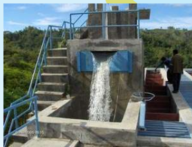
Een nieuwe waterzuiveringsinstallatie in Oost-Indonesië

De samenwerking tussen WMD en ontwikkelingsorganisatie Simavi is gericht op de watervoorziening en verbetering van sanitaire voorzieningen in de plattelandsgebieden rond een aantal steden in Oost-Indonesië. De lokale bevolking wordt direct betrokken bij dit project. Het programma is mogelijk gemaakt door een bijdrage van € 120.000,- van het Ministerie van Ontwikkelingssamenwerking (via Partners voor Water). Kijk voor meer informatie op www.wmd.nl .