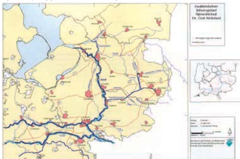
Figuur 2.1 Toepassingsgebied beleidsnotitie (beheersgebied RWS DON)

Ook baggerspecie die vrijkomt bij reguliere onderhoudswerkzaamheden evenals gebieden binnen de bebouwde kom vallen niet onder de reikwijdte van de beleidsnotitie.