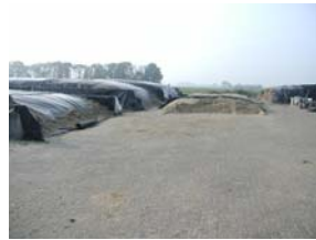
Opslag ruwvoer en werkgedeelte erf