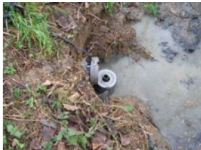
Monsterunit onder afvoerbuï

In de periode januari tot en met juli 2008 is het effluent van erfafspoelwater op de deelnemende veehouderijbedrijven onderzocht door onder de afvoerbuï van het werkgedeelte van het erf 4 een monsterunit te plaatsen (zie foto). Daarna is door een medewerker van het desbetreffende waterschap zesmaal een steekmonster genomen aan de hand van een opgesteld bemonsterprotocol (bijlage 4). Tijdens ieder bezoek is een logboek ingevuld om inzicht te krijgen op de erfsituatie en omstandigheden op dat moment (bijlage 5).