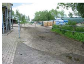
Koepad in gebruik