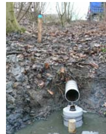
Meetunit onder afvoerbuï

Bij de monsternamen zijn de volgende afspraken gemaakt (zie ook bemonsterprotocol):