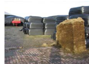
Ruwvoer op het erf