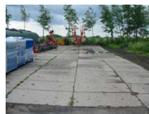
Kuilplaat voor opslag grasbalen