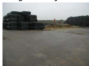
Opslag ruwvoer op het erf