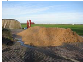
Aardappelvezels op het erf