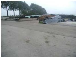
Scheiding schoon - vuil erf