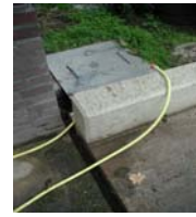
opvang en afvoer naar mestkelder