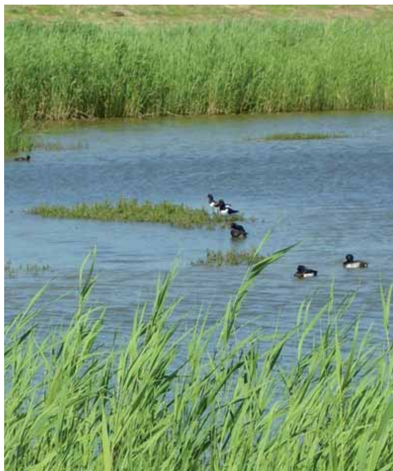
Kuifeenden en scholeksters in de Speketerspolder.

voldoende zuurstof in en er is geen algenbloei ontstaan. Alleen in de poelen is de kwaliteit slechter. Het gebied is ingericht met helofyten, maar deze lijken niet bij te dragen aan verbetering van de waterkwaliteit. Het aantal moeras- en hooilandplanten breidt zich uit. Er komen veel vogelsoorten voor, waaronder dodaars en baardmannetje. Het gebied vergroot daardoor de waarde van de Provinciale Ecologische Hoofdstructuur. Er treedt wel verruiging op. Regelmatig maaien kan daar een goede oplossing voor zijn.