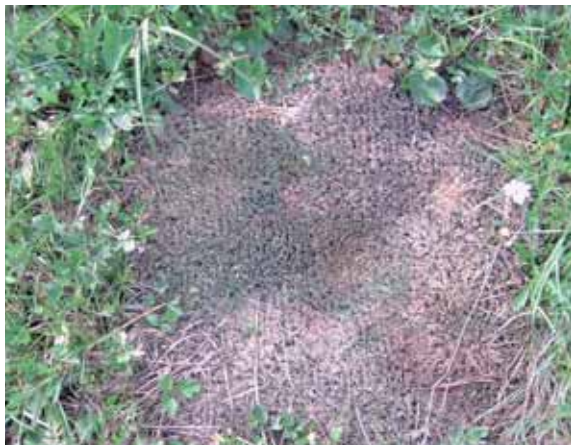
Mat t.b.v. sedimentatiemeting.

Het retentiegebied Logtse Baan staat ieder jaar meerdere malen onder water, ook in de zomer. Vooral in winter en voorjaar treden langdurige