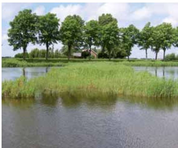
Het water staat erg hoog: waarschijnlijk hebben er hierdoor geen vogels gebroed op de eilandjes (2007).

De waterkwaliteit in het bergingsgebied is redelijk goed. Het water is wel rijk aan fosfaat, maar er zit