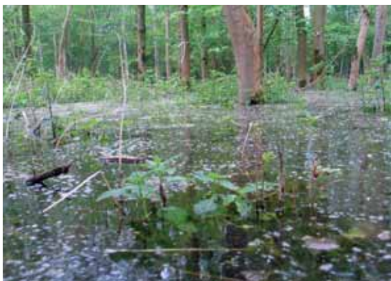
Volgestroomd proefvlak (voorjaar 2005).