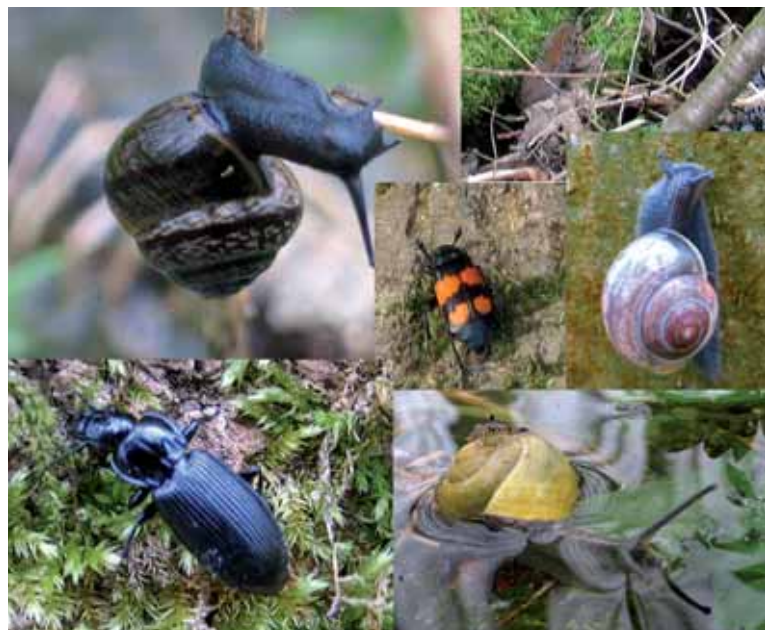
Vluchtende insecten, slakken en muizen tijdens vullen.

Bij plotselinge overstroming zal de fauna direct effecten ondervinden. Waargenomen is dat muizen en insecten naar hoger gelegen plaatsen of in bomen vluchten. Een deel van de dieren zal verdrinken, vooral