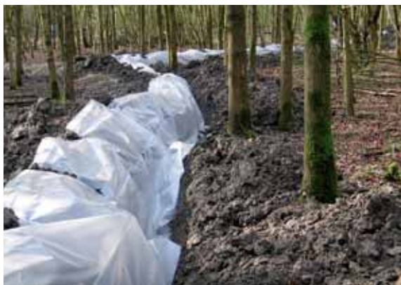
Proefvlak met eiken: aanleg van kaden met folie.

De ondergroei bestaat in deze bossen uit ruigtesoorten. Alleen na overstroming in het voorjaar verdween deze vegetatie gedeeltelijk en daardoor nam de soortenrijkdom in ondergroei toe. Dat effect was in essenbos sterker dan in eikenbos. Maar op langere termijn zal de ruigtevegetatie weer terugkomen. De overstromingen hebben geen effect op de vitaliteit en de groei van de bomen. Wel hebben eiken in het jaar van de overstroming kleinere houtvaten gemaakt, waardoor het watertransport door de boom vermindert.