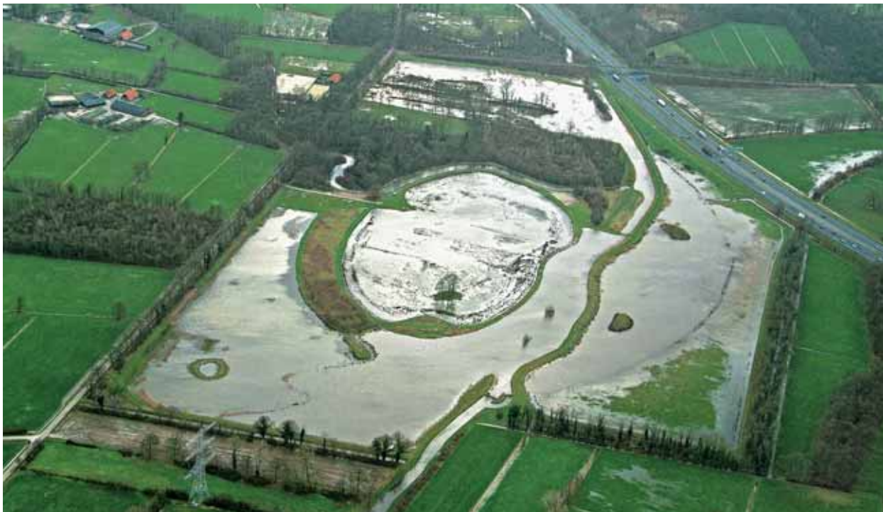
Retentiebekken Woolde is volgestroomd (januari 2007).

Het gebied is aantrekkelijk voor watervogels, die schuilgelegenheid vinden tussen het riet en lisdodde in het open water.